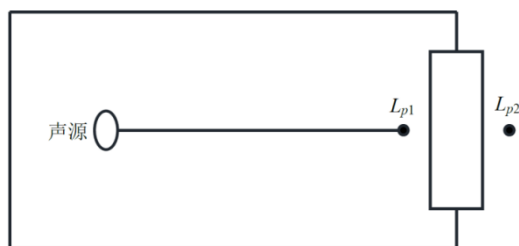
图3 室内声源等效为室外声源

设靠近开口处（或窗户）室内、室外某倍频带的声压级或 A 声级分别为 L_{p1} 和 L_{p2} 。若声源所在室内声场为近似扩散声场，则室外的倍频带声压级可按下式近似求出：